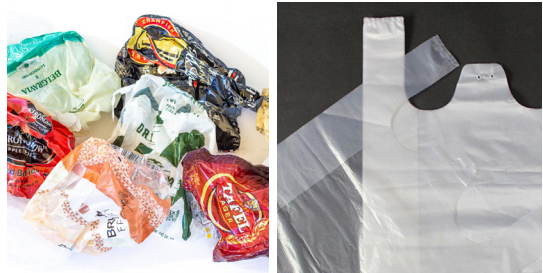
Plastics: wrappers, plastic bags, cling wrap, etc