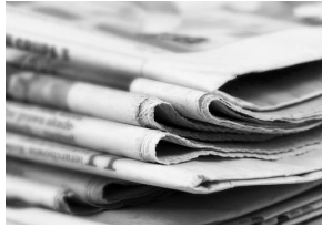
Paper and newspaper