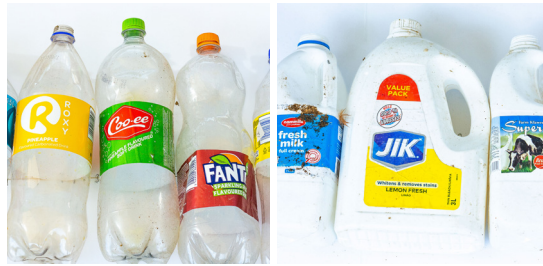
Plastic bottles & containers: clear or white

Mubuze ba libaka za milonganyana kuamana ni pisinisi ya babaleka lika za kupanga fa lika zene kile za sebeliswa kale ili kuli mukale kufumana lituwelo ni za butokwa fa masila.